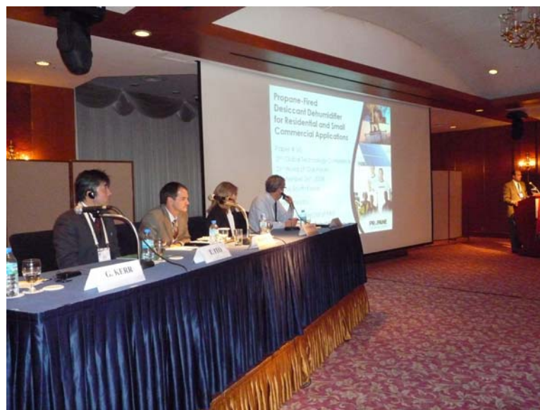
技術論文発表の様子

フォーラム終了翌26日、2006年10月のWLPGAシカゴ大会での第1回GTC (Global Technology Conference、世界技術会議)での併催スタートから隔年で開催されことになった第2回GTCが行われました。